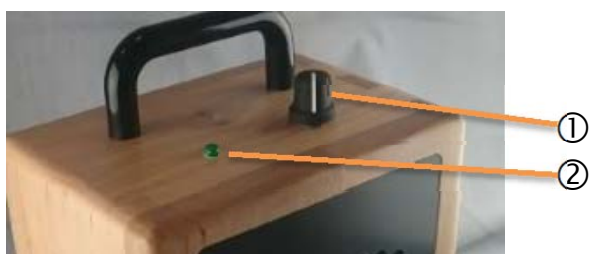
Figur 1 Kontroller