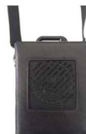
UNOBAG Varenr. 1478

En praktisk bæreveske med skulderstropp er også tilgjengelig. Bildet er et illustrasjonsfoto.