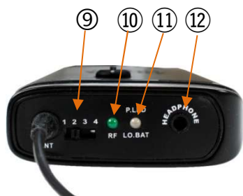
Figur 3 Mottakeren topp