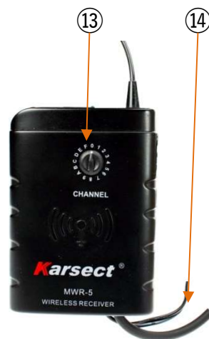
Figur 4 Mottakerens kanalvelger