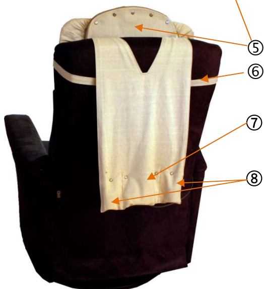
Figur 2 Lydputen over stolrygg